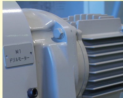
機械の名称表示などに